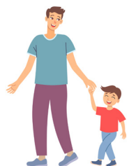
Väter mit Kind bis 6 Jahren